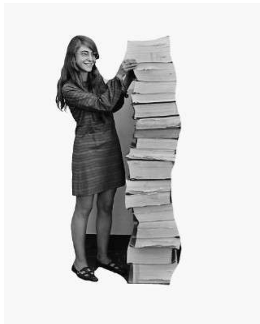
Margaret Hamilton, programmatrice informatique des missions Apollo 8 et 11

et à l'Auditorium de Coulanges à Gonesse (95)