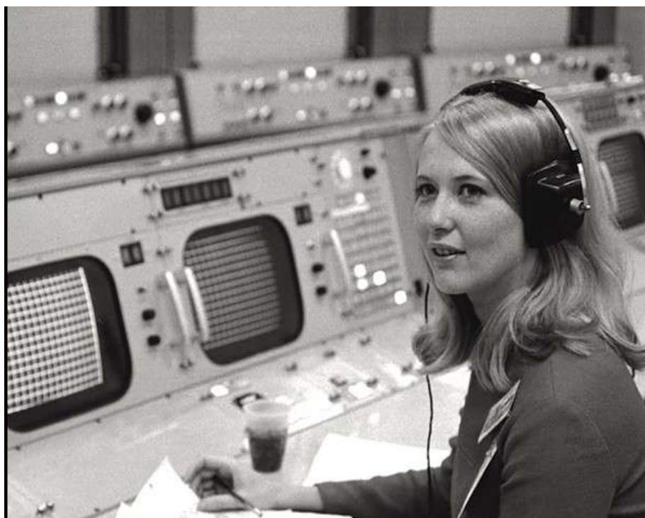
Poppy Northcut, calculatrice et ingénieure à la NASA

ELLES ONT MARCHÉ SOUS LA LUNE raconte la possibilité d'une émancipation par l'accès aux sciences. Dans sa forme, le spectacle propose également des formes d'émancipations aux spectateurices : faire confiance à son imaginaire et construire son propre spectacle en choisissant quand regarder, quand fermer les yeux, quand écouter seul·e, quand écouter ensemble.