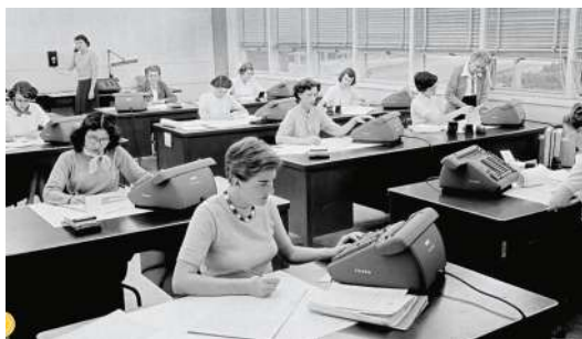
Les calculatrices humaines de la NASA

Ainsi les trois interprètes dialoguent de leurs mots et de leurs instruments, leurs harmonies donnent du souffle à Nancy et leurs rythmes de la force dans les pieds.