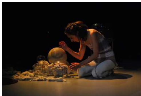
Vox, le mot sur le bout de la langue